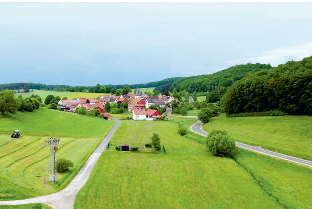
Thurnhosbach – Idylka v severním Hesensku