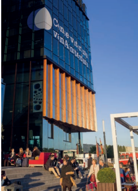
Vlevo: Vedle futuristické fasády nabízí hotel Conservatorium útulnou venkovní terasu.

Mezi Frískem a Severním Holandskem se rozkládá největší jezero v Nizozemsku, IJsselmeer. Pěkné rybářské vesnice, krásná příroda a zároveň vynikající oblast pro plachtění. Region je pro sportovně založené snadno dostupný na kole. Také místní jídlo stojí za pozornost.